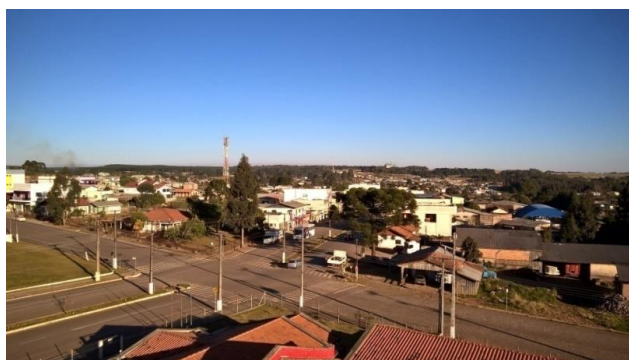
Figura 7. Imagem do município