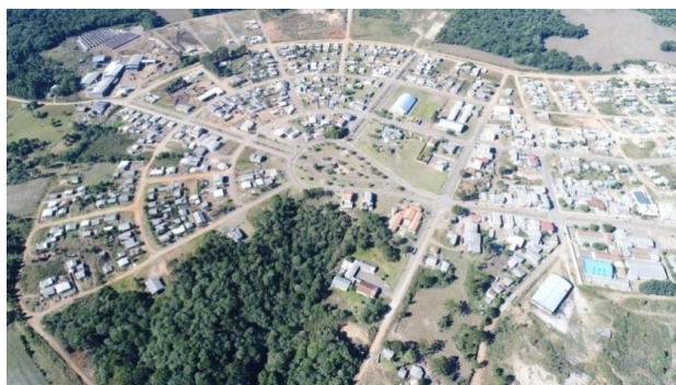
Figura 6. Imagem do município