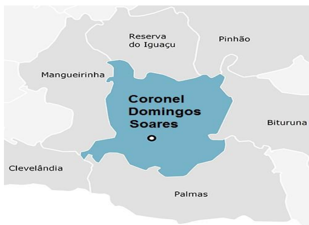
Figura 4. Municípios limítrofes de Coronel Domingos Soares.

Limita-se ao Norte com Reserva do Iguaçu e Pinhão, ao Sul com Palmas, a Oeste com Mangueirinha e Civelândia e a Leste, com Bituruna.