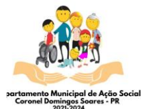
Figura 5. Imagem do município