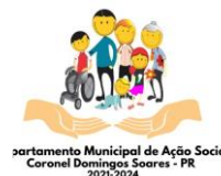
Figura 2. Bandeira Municipal.